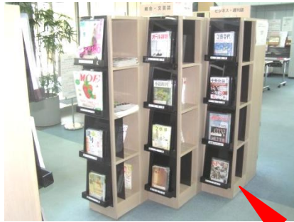
ブラウジングコーナー全体