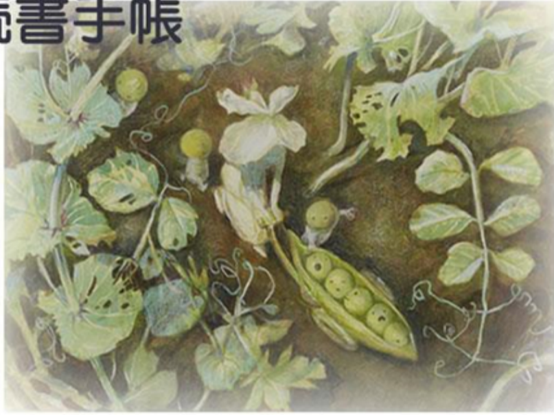
長久手市中央図書館