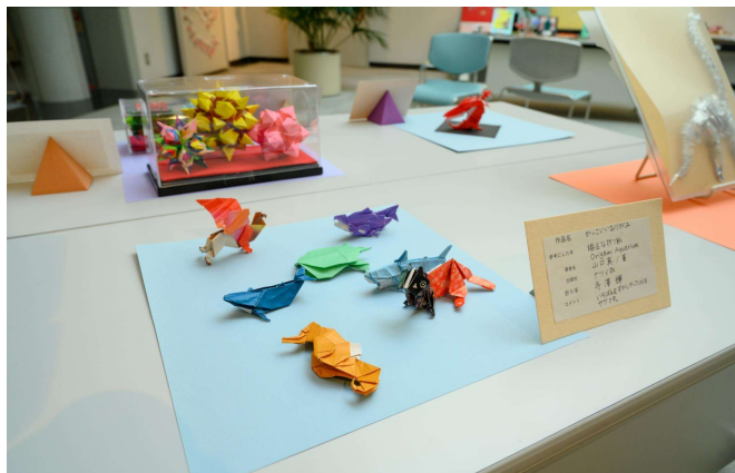
↑利用者の方から募集した作品（一部）