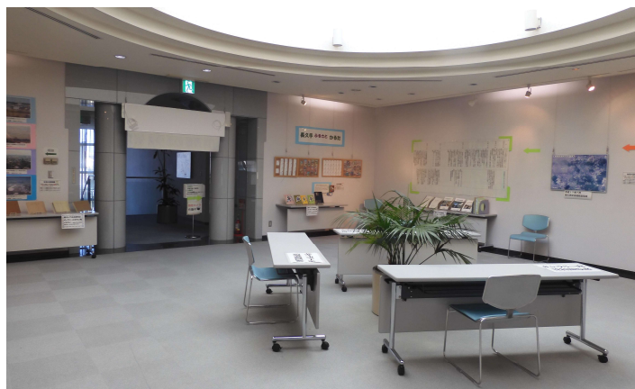
↑ギャラリースペース内写真

図書館開館からの主な動きや図書館関連の長久手市（町）内の主な動きをまとめた手作りの歴史年表や、図書館、長久手市の歴史に関する郷土資料・写真・パネル等を展示しました。